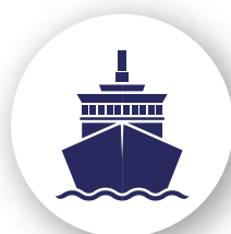
Naval / Maritime