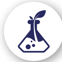
Pharmacie / Agro / Cosmétique