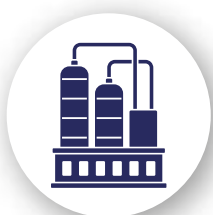
Pétrole & Chimie