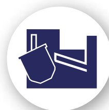
Sidérurgie / Équipements